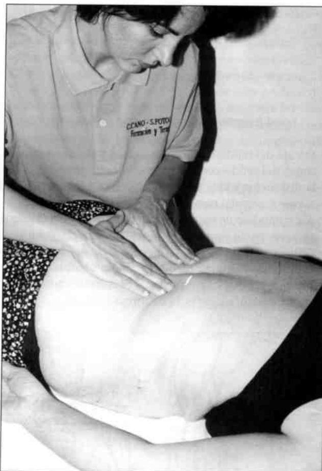
Examen de reconocimiento, deslizamiento cutáneo. Se puede apreciar la contracción del tejido cutáneo y conjuntivo.