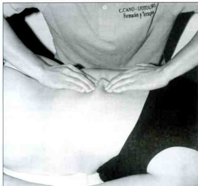
Manipulación interespinosa provocando una gran hiperemia en las zonas más cercanas a los radicales nerviosos

El Masaje Segmental no tonifica en el sentido como lo hace el masaje clásico, sino que aplica el estímulo cuti-mio-visceral, el cual a través de los filamentos vegetativos provoca una hiperemia tanto en el órgano interno como en la capa de la piel a través del efecto de la manipulación. 🖐